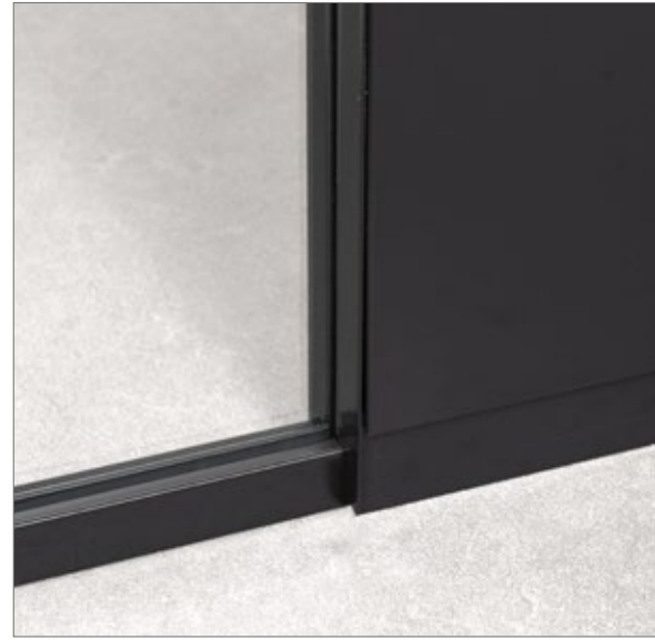
Үл үзэгдэх холбоос