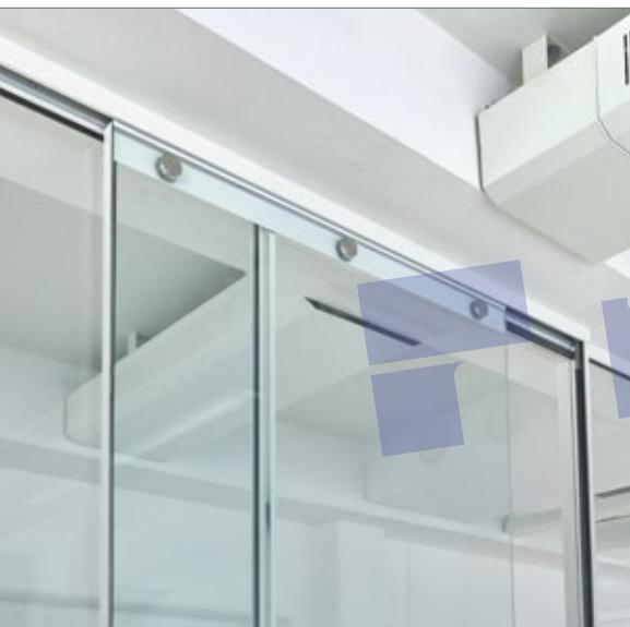
Acoustical sliding door