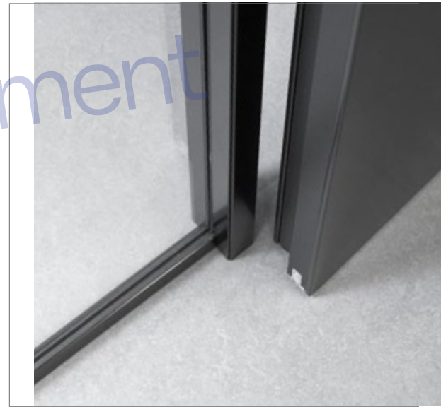
Хана болон хаалганы төгс зохицол