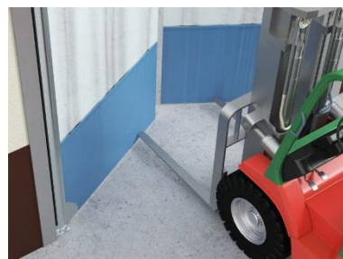
Энгийн ба хэрэглэхэд хялбар