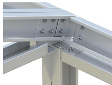
Металл каркасны бүтэц